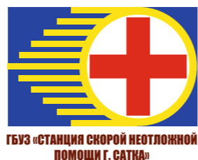
ГБУЗ «СТАНЦИЯ СКОРОЙ НЕОТЛОЖНОЙ ПОМОЩИ Г. САТКА»