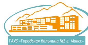
ГБУЗ «Городская больница №2 г. Миасс»