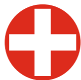
ГБУЗ Областная больница г. Сатка