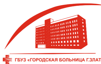
ГБУЗ «ГОРОДСКАЯ БОЛЬНИЦА Г.ЗЛАТОУСТ»